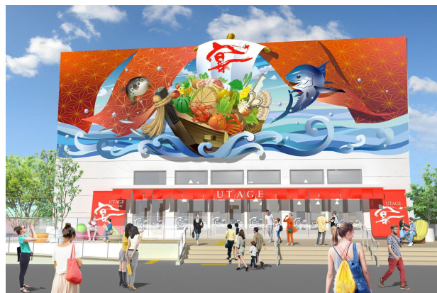
ORA外食パビリオン『宴～UTAGE～』